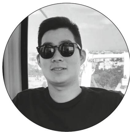
Пак Бёнву, Южная Корея:

И ностранные студенты НГУЭУ рассказали о том, как принято встречать Новый год в их странах, а также поделились праздничными традициями своих семей.