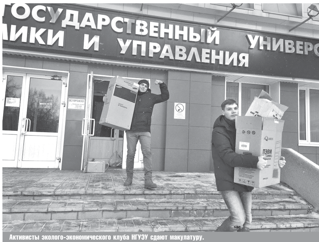
Активисты эколого-экономического клуба НГУЭУ сдают макулатуру.

— В нашей стране, и в Новосибирске в частности, невысокий уровень жизни населения, — говорит заведующая кафедрой