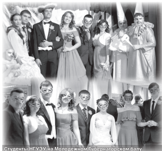
Студенты НГУЭУ на Молодежном Губернаторском балу

Молодежный Губернаторский бал ежегодно проводится с целью формирования и продвижения позитивного образа студенческой молодежи, а также для поощрения лучших студентов вузов Новосибирска и области.