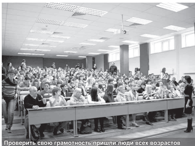
Проверить свою грамотность пришли люди всех возрастов

Около четырехсот человек собралось в нашем университете 6 апреля, чтобы поучаствовать в уже ставшей традиционной и даже международной акции «Тотальный диктант». Текст писательницы Дины Рубиной, написанный специально для этого своеобразного флешмоба, был посвящен Интернету — его недостаткам и преимуществам.