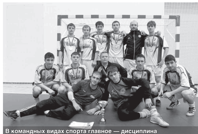
В командных видах спорта главное — дисциплина

— Разумеется. Играть буду точно, но не постоянно — к тому времени работа будет важнее игр.