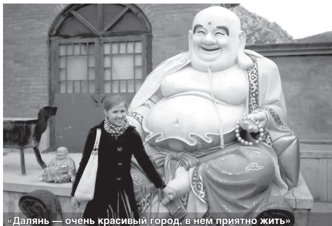
«Далянь — очень красивый город, в нем приятно жить»

— В основном да, примерно 3 курс по нашим меркам. Хотя исключения тоже встре-