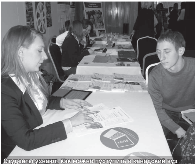
Студенты узнают, как можно поступить в канадский вуз

Иностранные студенты после окончания университета имеют право остаться работать в Канаде на срок до 3 лет. Дипломы всех высших учебных заведений являются международными и котируются во всех странах мира.