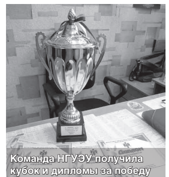
Команда НГУЭУ получила кубок и дипломы за победу