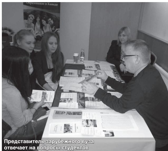
Представитель зарубежного вуза отвечает на вопросы студентов

Чешские университеты предлагают обучение по программам бакалавриата, магистратуры и докторантуры, а преподаватели являются настоящими профессионалами и знатоками в своей области. Поступление происходит на основании общего конкурса, обучение в государственных вузах является бесплатным. Исключение составляют европейские бизнес-школы и частные международные университеты.