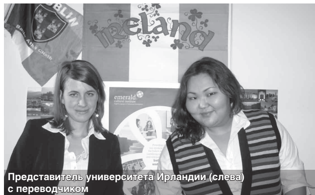
Представитель университета Ирландии (слева) с переводчиком

Но когда речь заходит об образовании, шутить не стоит! Ирландские дипломы и сертификаты признаются во всем мире, ежегодно обучение в этой стране проходят более двухсот тысяч студентов. Столь высокая популярность Ирландии обусловлена превосходным качеством обучения, ни в чем не уступающего британскому, и возможностью совмещения курсов с уникальной культурной программой.