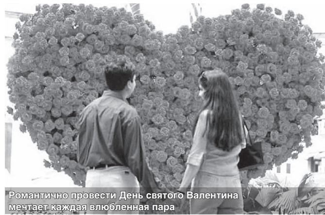
Романтично провести День святого Валентина мечтает каждая влюбленная пара

Если душе хочется праздника, то необходимо заглянуть в календарь. А лучше в интернет. Уж там-то точно обнаружится, что именно сегодня китайцы празднуют Новый год, норвежцы — скандинавскую Масленицу, а братья славяне — День домового. Так что можно выбирать из списка и отмечать по всем канонам, даже если праздник в России редкий или вовсе неизвестный. Знаменательные дни теперь кочуют из народа в народ, приобретая в каждой стране свои особенности. И только исконные «владельцы» праздника знают его истинную суть. Так произошло и с Днем святого Валентина.