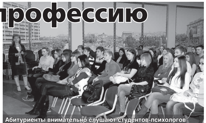
Абитуриенты внимательно слушают студентов-психологов

В этом году участвовали 72 школьника. Для проведения ознакомительных тренингов ребят распределили по группам. Двумя группами руководили студентки 4-го курса —