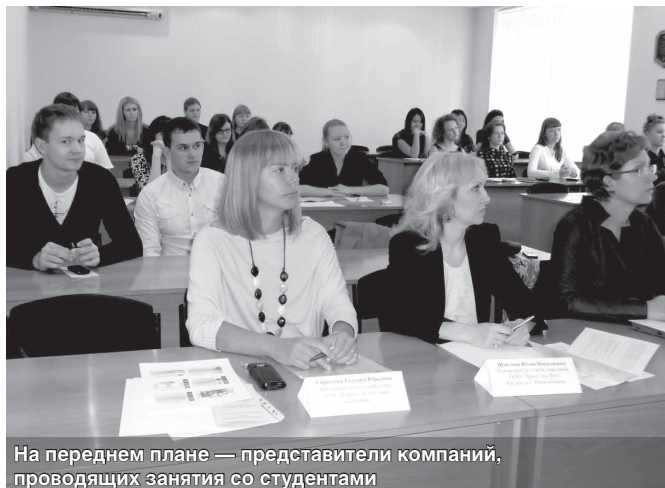
На переднем плане — представители компаний, проводящих занятия со студентами

С ребятами в течение года работают представители крупнейших компаний.