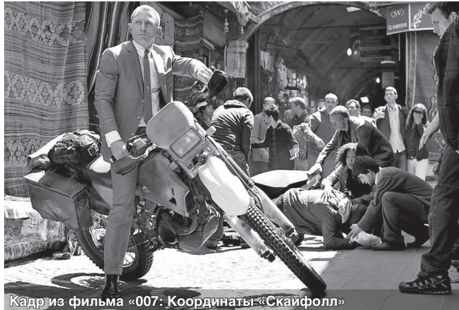
Кадр из фильма «007: Координаты «Скайфолл»

«Зовите меня Бонд. Джеймс Бонд». Эта фраза наверняка знакома почти всем и, признайтесь, многие репетировали ее перед зеркалом. Агент британской разведки с лицензией на убийство, покоряющий женщин одним взглядом и всегда одетый «с иголки» — если это не герой нашего времени, то тогда вообще не знаю, кого можно так назвать!