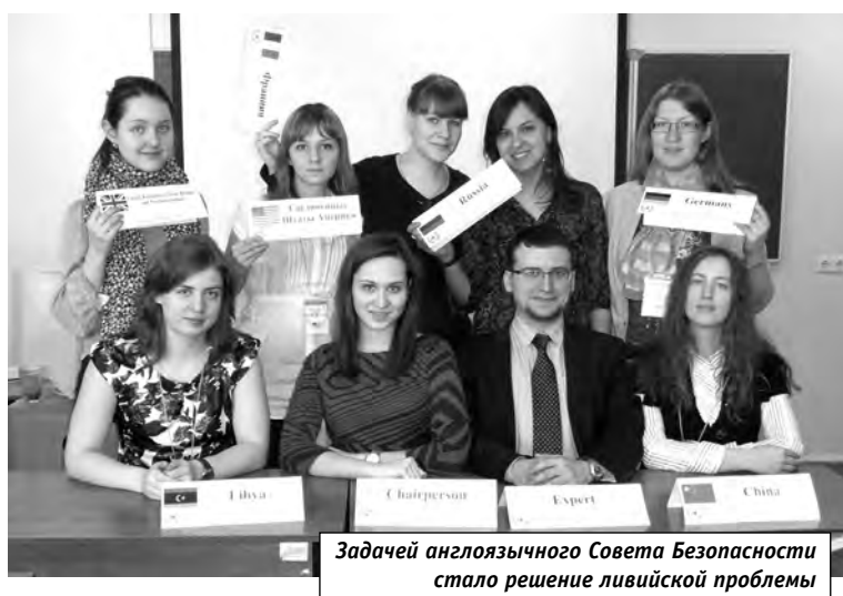
Задачей англоязычного Совета Безопасности стало решение ливийской проблемы