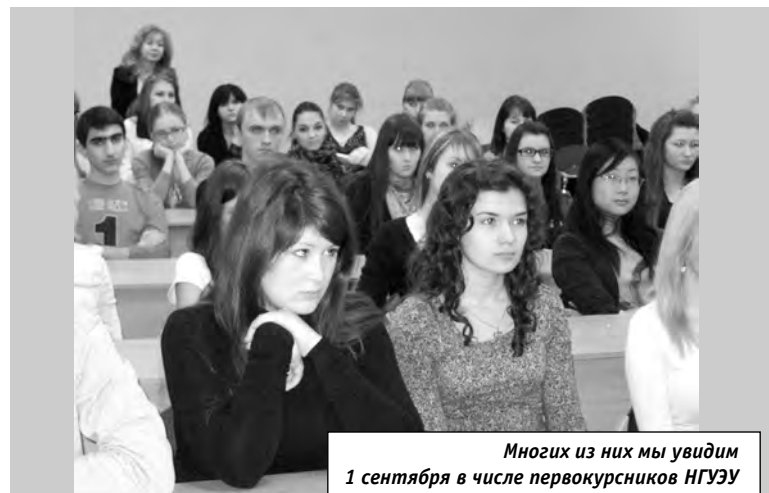
Многих из них мы увидим 1 сентября в числе первокурсников НГУЭУ

называются Women's Time, они объединены с миниатюрной пудрицей. У мужских тоже есть карман, а название им придумано Midnight. И в одни, и в другие вмонтирован аудио-плеер с беспроводными наушниками. Новый гаджет ориентирован на молодежную аудиторию, соответственно, и цена у него небольшая.