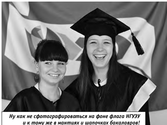
Ну как не сфотографироваться на фоне флага НГУЭУ и к тому же в мантиях и шапочках бакалавров!