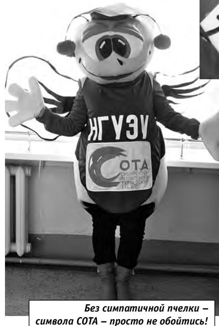
Без симпатичной пчелки – символа СОТА – просто не обойтись!

Александр ЧЕРЕШНЕВ Фото Виктории МИЛЯЕВОЙ (гр. 1045у)