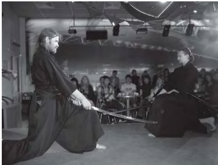
Боевое искусство японских самураев демонстрируют «самураи» новосибирские