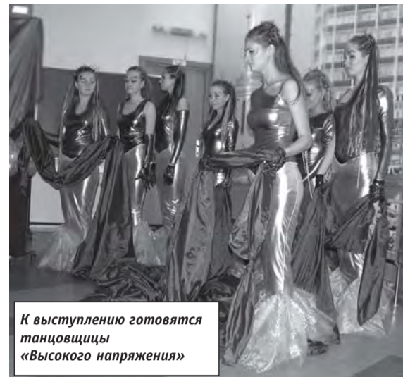
К выступлению готовятся танцовщицы «Высокого напряжения»