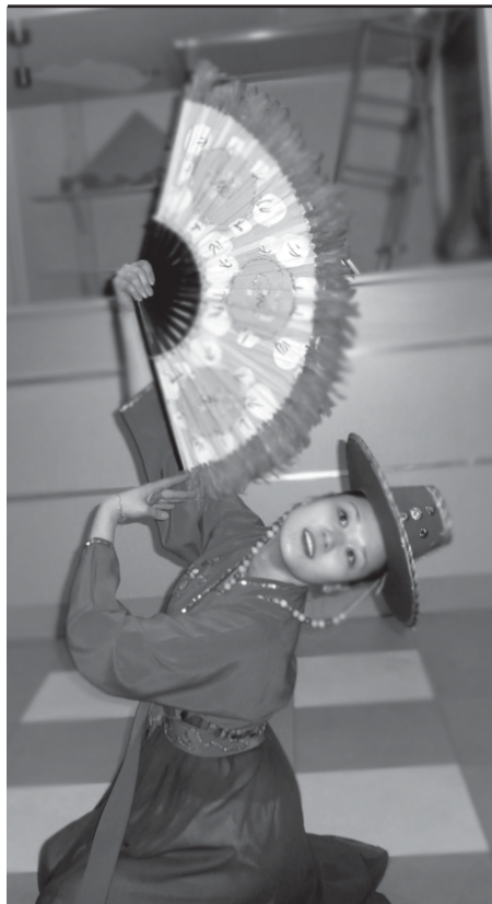
Всех очаровала грациозность танца с веером