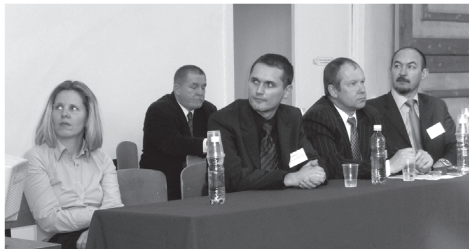
Руководители ЦСТВ и представители бизнес-сообщества Новосибирска на презентации программ ЦСТВ

И еще раз хочется напомнить, что Центр содействия трудоустройству приглашает всех на презентацию образовательно-практических программ на второй семестр. Она состоится 17 февраля в 15.55 в аудитории 3-206. Начинайте карьеру с нами!