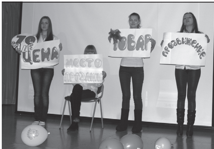
Фантазия, юмор, яркое оформление – все это присутствовало в выступлениях групп