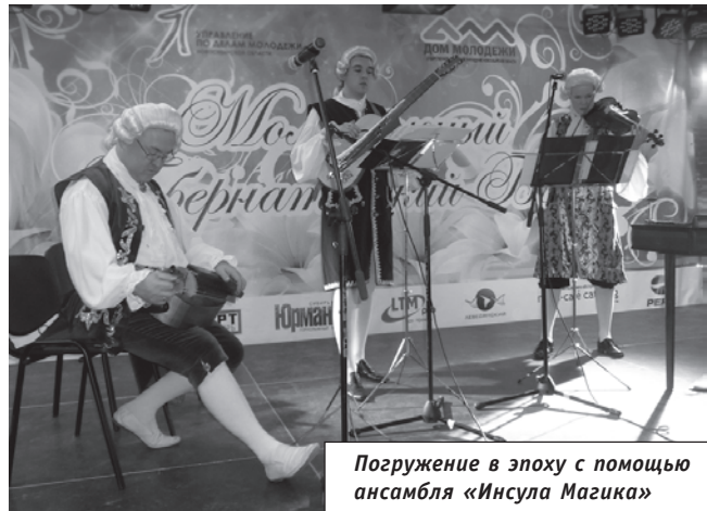
Погружение в эпоху с помощью ансамбля «Инсула Магика»