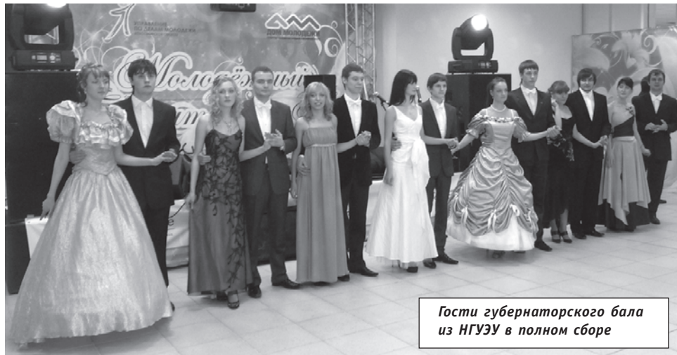
Гости губернаторского бала из НГУЭУ в полном сборе

...Нельзя обойти вниманием трагический момент, омрачивший празднование. Буквально за день до столь долгожданного бала произошел теракт в московском аэропорту Домодедово. К сожалению, перенести бал на другой день не представлялось возможным по техническим причинам. Память погибших присут-