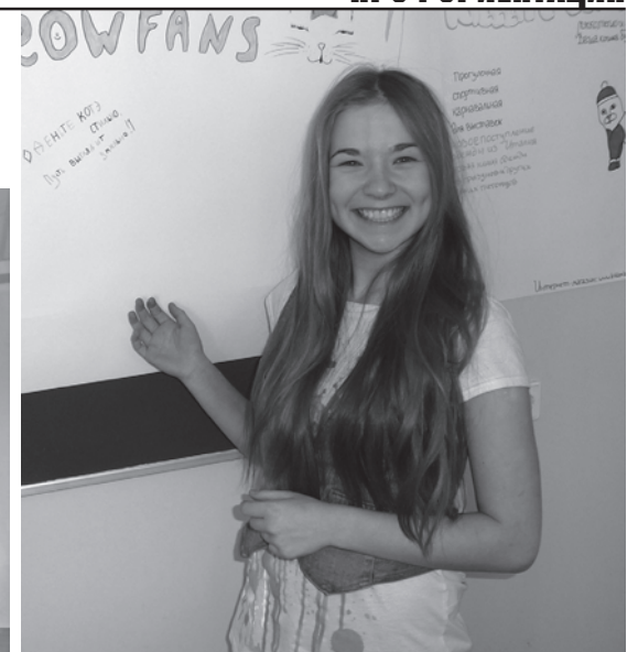
Оказывается, быть маркетологом – это так интересно!

Отточив свои навыки, ведущие Школы маркетологов отправились по школам. Повезло гимназии № 15 и экономическому лицей № 95. За окном стояли жаркие летние дни, манящее светило солнце, но в кабинетах, где проходили заседания Школы маркетологов, был аншлаг. К эффективной презентации добавились усовершенствованная бизнес-игра. Старшеклассникам нужно было усердно поработать над определенным товаром, сделать его еще привлекательнее, найти в нем скрытые возможности. Разделившись на команды, ребята проделали практически всю работу, которой занимаются маркетологи – от выбора товара и рынка до рекламы и представления товара публике. Оригинальные идеи и красочные презен-