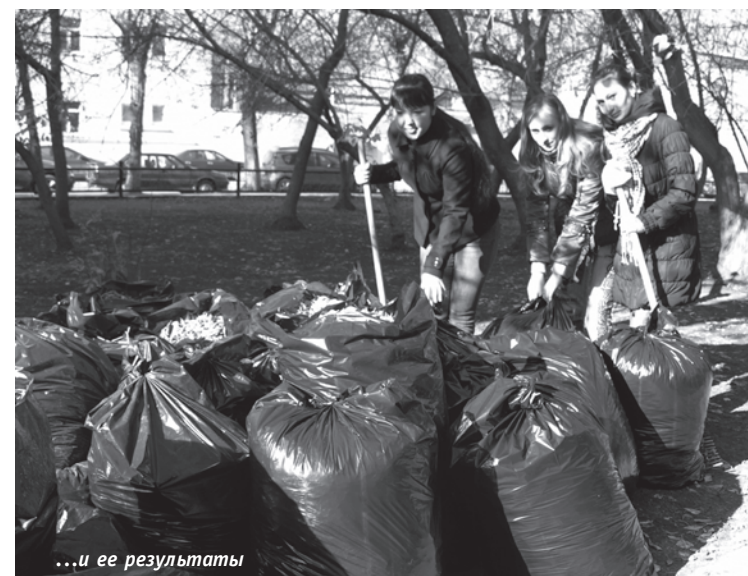
...и ее результаты

Привести в порядок территорию около университетских корпусов выходят каждую осень с граблями и лопатами студенты. На наших фотографиях запечатлены первокурсники специальности «Бухгалтерский учет, анализ и аудит» из группы 0051, наводящие чистоту около первого корпуса. Денек выдался погожим, теплым, размяться физической работой под прощальными лучами солнышка было одно удовольствие. С делом своим ребята и девушки справились быстро и хорошо.