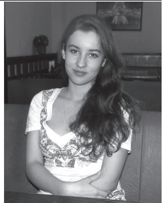
... и в обычной жизни

Она поделилась некоторыми любопытными фактами из истории восточных танцев, которые, оказывается, глубоко коренятся в народном быте. «Например, традиция исполнения танца халиджи, или танца волос, связана с тем, что с помощью особых движений, похожих на танец девушки в древности сушили волосы. А танец саиди, исполняемый с тростью, издавна сопровождал труд пастухов».