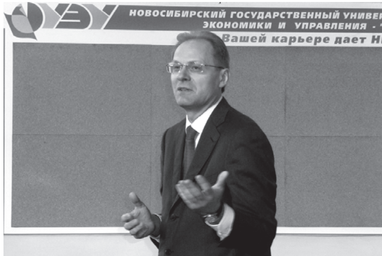
Губернатор высоко оценил потребность региона в специалистах, которых готовит НГУЭУ