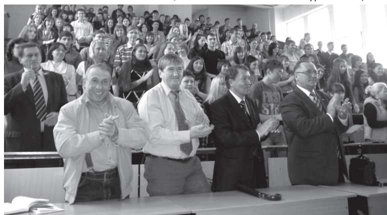
Собравшиеся с энтузиазмом встретили главу региона