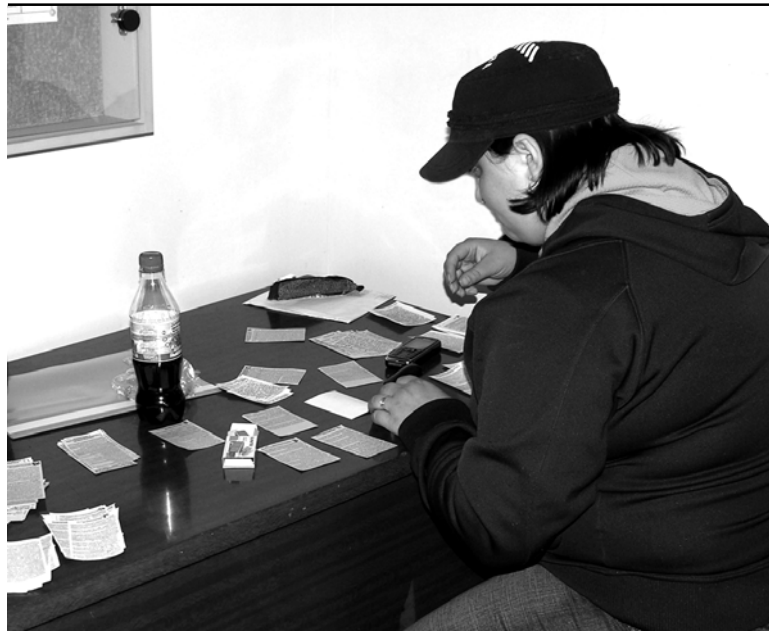
К экзамену готова!