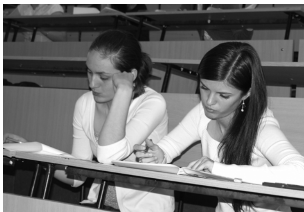
Чтобы написать работу, нужно вспомнить все, чему учили преподаватели на протяжении четырех лет