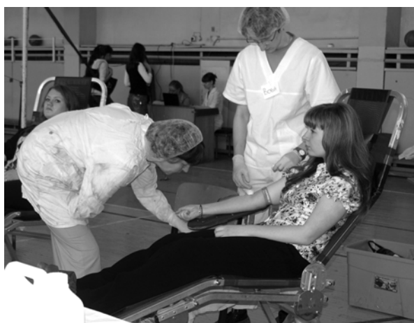
Ну вот, все позади

Неизвестность всегда пугает. Так же было и перед первой сдачей крови. Что там будут делать? Как все будет происходить? А вдруг это больно? Но все оказалось не так страшно. Каждого донора встречают с улыбкой, каждому рады. Перед тем как сдать кровь из вены, ее берут на анализ из пальца и определяют группу и резус-фактор. Так что если человек этих данных не знал, он заодно получает такую информацию. У меня оказалась вторая положительная. Правда, не только у меня, у большинства доноров была такая же группа крови. Следующий этап – кабинет терапевта. И в нем нет ничего страшного, ведь спрашивают только о болезнях, прививках, операциях и так далее. И вот настает самый ответственный момент: за белой ширмой стоит несколько кресел, и все свободны – выбирай любое!