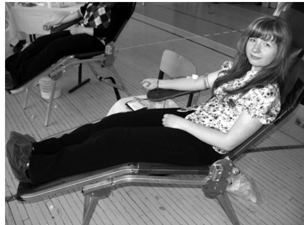
Оказывается, совсем не страшно...