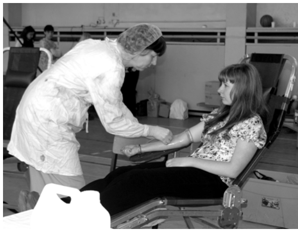
Ой, сейчас начнется!

Студенты НГУЭУ охотно откликаются на подобные акции. Узнав о том, что у нас будет проводиться очередной День донора, я решила, что обязательно пойду